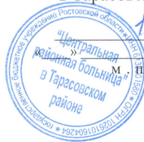
График доставки лиц старше 65 лет в ГБУ РО "ЦРБ" в Тарасовском районе ноябрь 2023 г.