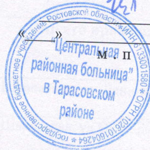
График доставки лиц старше 65 лет в ГБУ РО "ЦРБ" в Тарасовском районе ноябрь 2024 г.